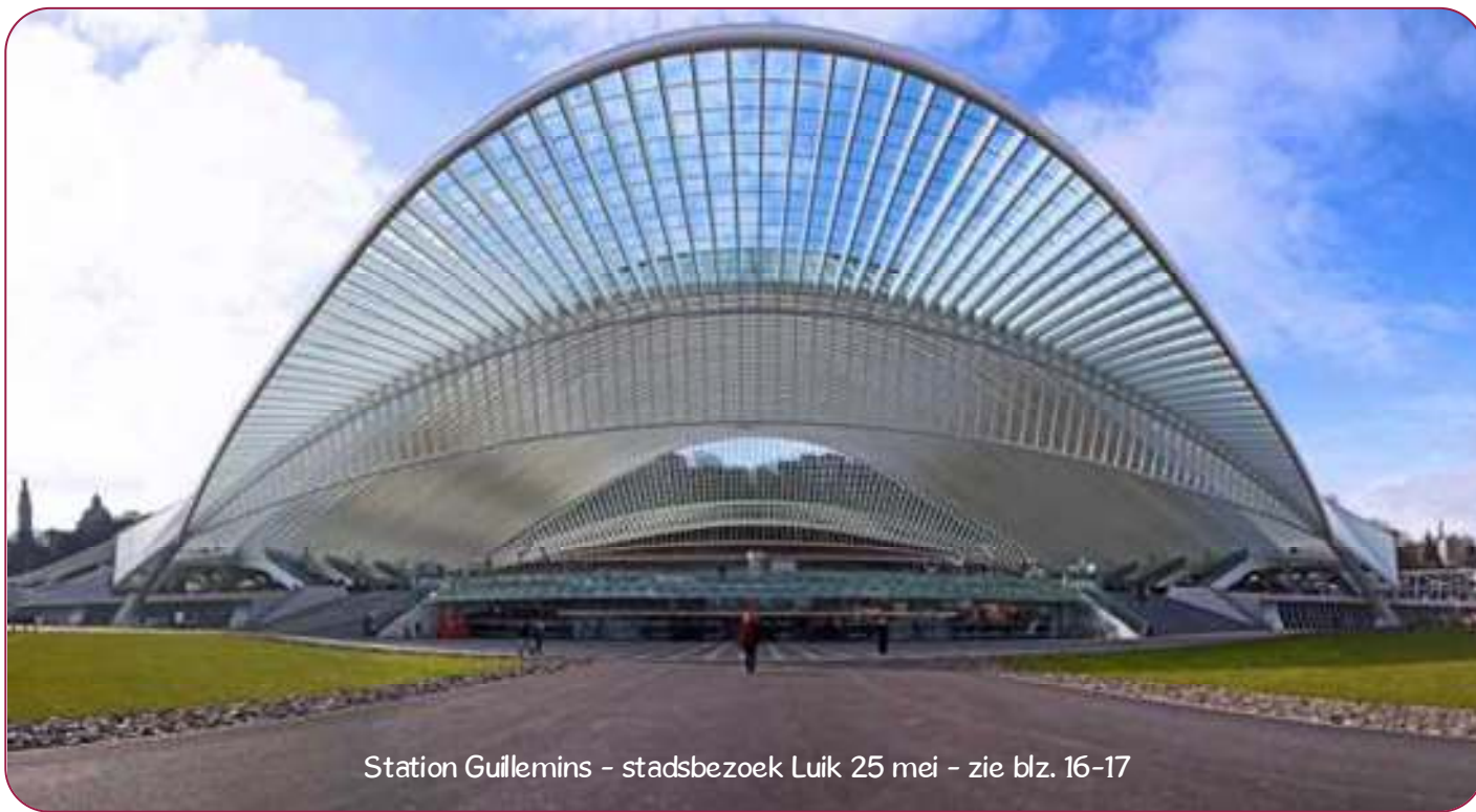
Station Guillemins - stadsbezoek Luik 25 mei - zie blz. 16-17