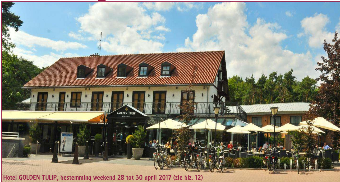
Hotel GOLDEN TULIP, bestemming weekend 28 tot 30 april 2017 (zie blz. 12)

tweemaandelijks ledenbladje / kwb zoersel sint-antonius / jaargang 37