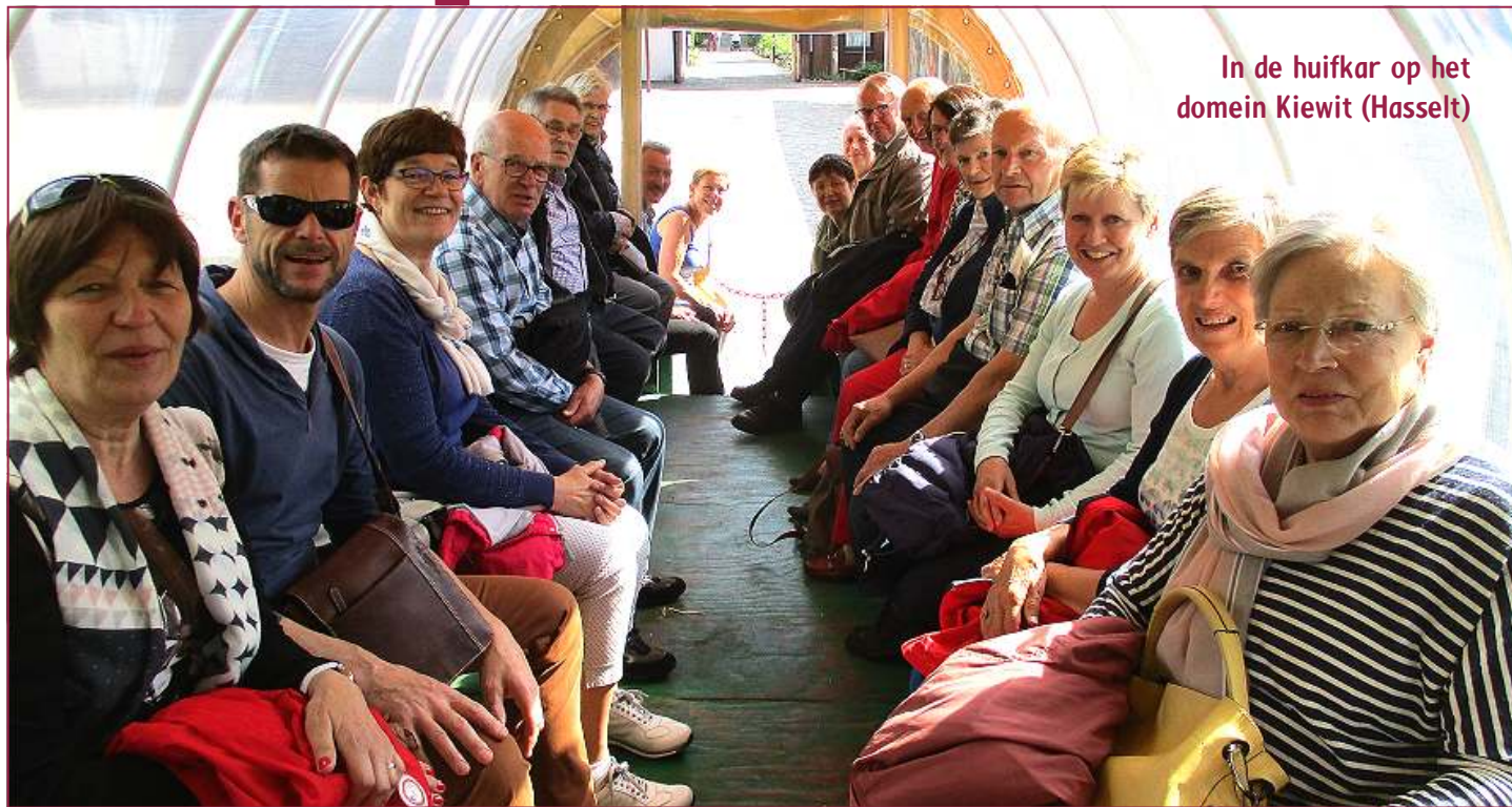
In de huifkar op het domein Kiewit (Hasselt)